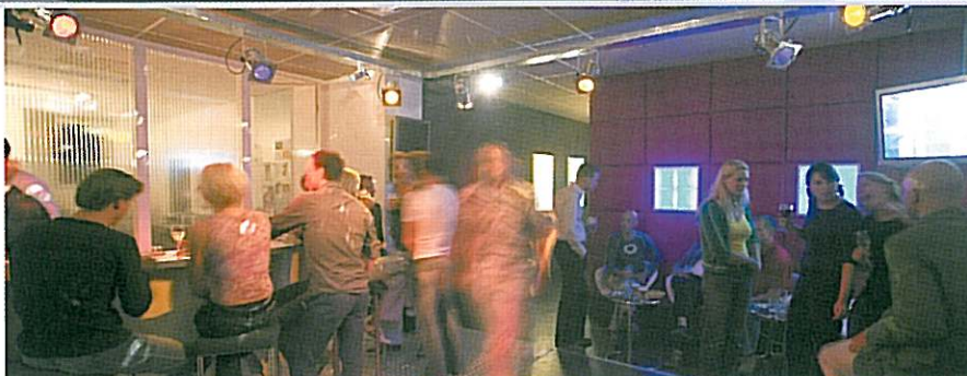
De lounge van VaVaVoom!

je set weer snel draaien. Met AEM hebben we goede ervaringen."